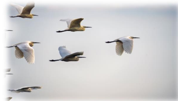
Gebrek aan samenwerking