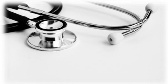
Onvoldoende kennis en deskundigheid